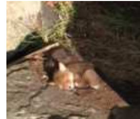
Reveunge noen trodde var forlatt, til vi fikk gitt dem råd.

Hvert år mottar vi flere hundre henvendelser, og i fjor var ikke noe unntak. 450 førstegangshenvendelser på e-post og sosiale medier, en økning fra i fjor, samt mange henvendelser direkte til styremedlemmer og frivillige. På "kattehjemmet" har vi kun katter. De fleste voksne katter og andre dyr som kaniner, fugler og gnagere er i fosterhjem mens de venter på å få et nytt hjem. En stor takk til fosterhjemmene som er snille og har åpnet hjemmene sine for et hjemløst dyr eller to!